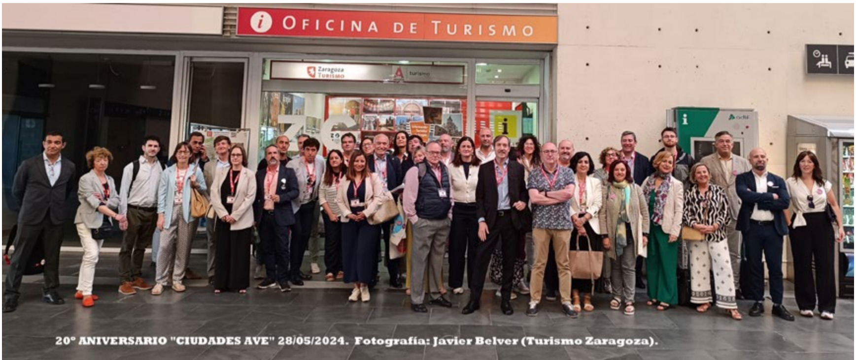
20º ANIVERSARIO "CIUDADES AVE" 28/05/2024.

La Red de Ciudades AVE celebró en mayo su 20º aniversario en Zaragoza con un completo programa y la asistencia de representantes y concejales de Turismo de las localidades conectadas por la Alta Velocidad.