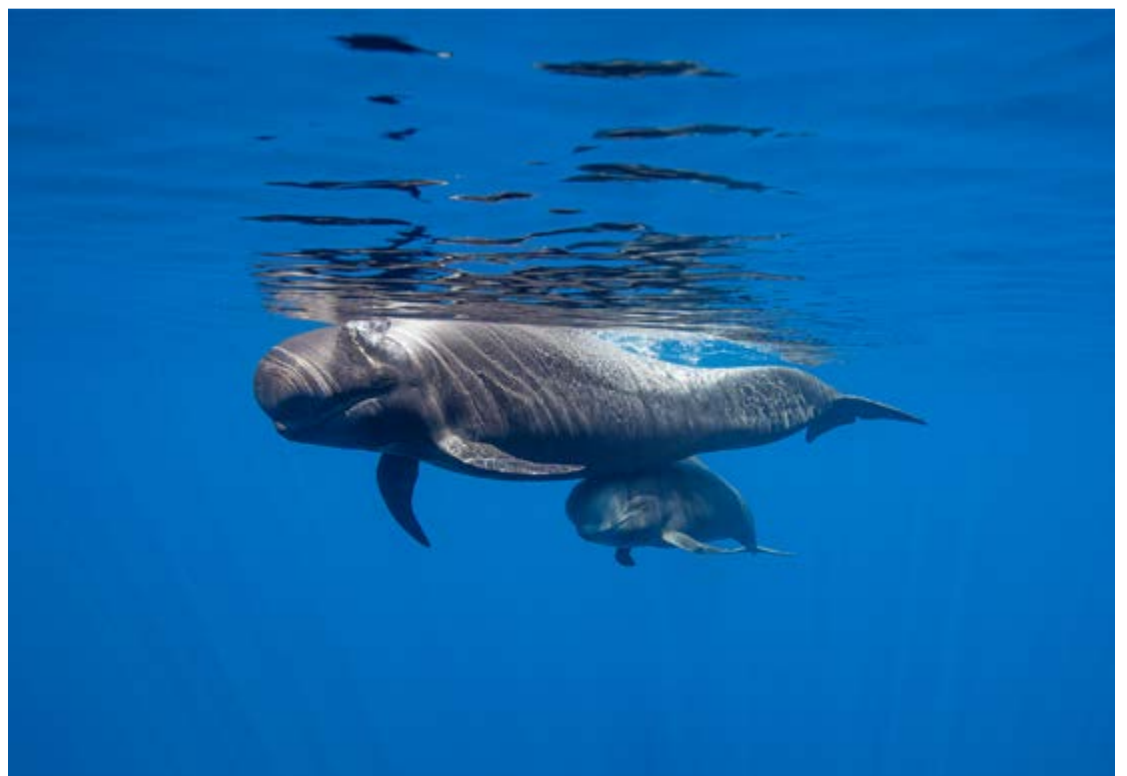
Cetáceos en aguas del suroeste de Tenerife.

Frente a esa modernidad, las tradiciones también se viven de manera muy intensa en Tenerife, por lo que es ideal descubrir la esencia de la isla en la propia Semana Santa, con actos litúrgicos y procesiones en todos sus rincones. Pero también sus romerías y bailes de magos o, cómo no, en el Carnaval de Tenerife, multitudinario y divertido, Fiesta de Interés Turístico Internacional.