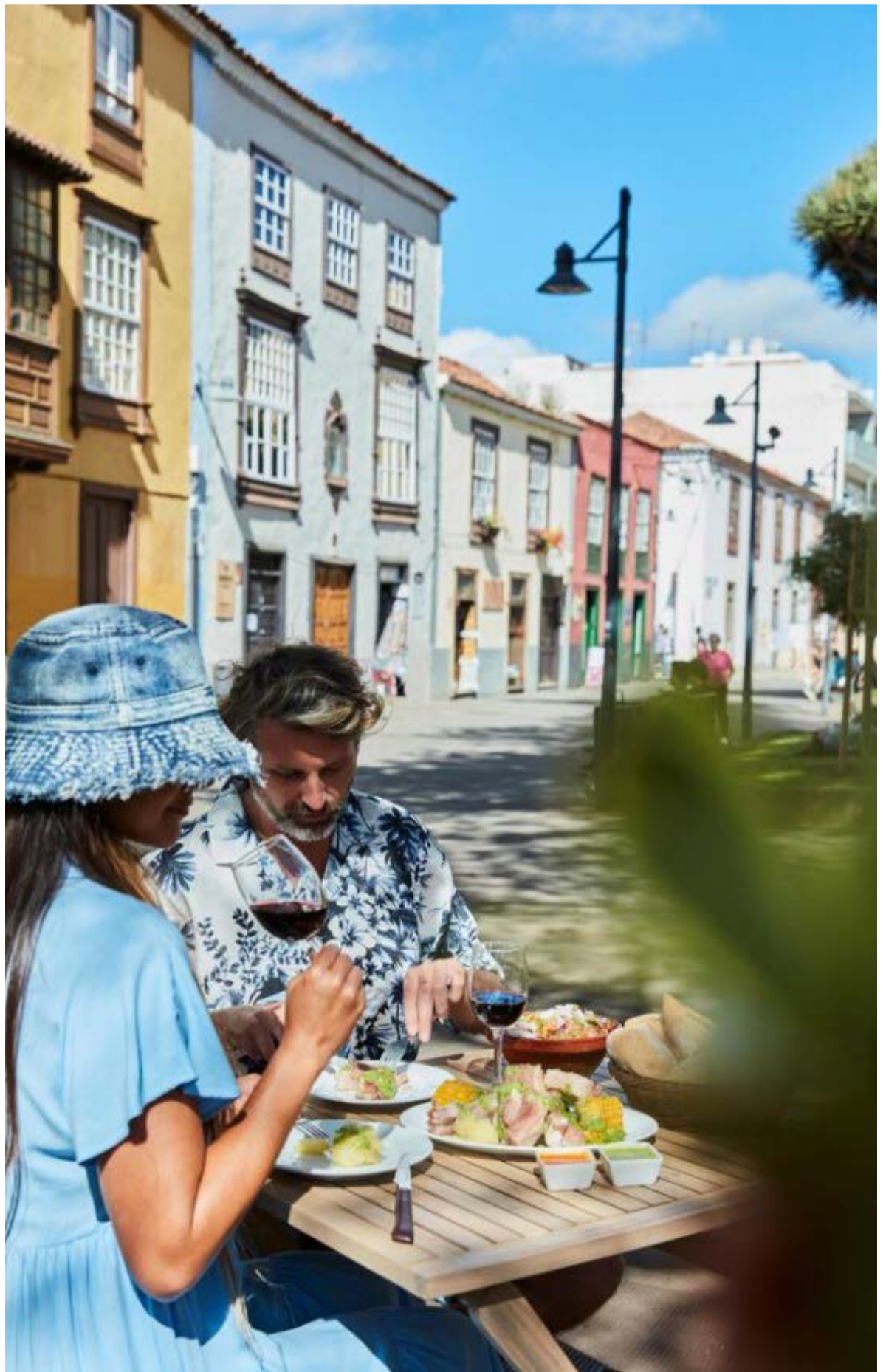
Gastronomía en La Laguna, Patrimonio de la Humanidad.

Más allá de esas actividades, la isla también reúne opciones para descubrir una gastronomía única, con influencias europea, americana y africana. Una cocina que ha evolucionado en los últimos años y ha dado lugar a una gastronomía creativa y original, con productos de calidad como el atún, el cochino negro o el aguacate. Todo ello acompañado de vinos locales, cuya historia se remonta al siglo XV. Las variedades de uvas, el clima y las peculiaridades del suelo volcánico de la isla hacen que los vinos sean de una originalidad y personalidad inigualables. Además, siete restaurantes de la isla suman, en total, nueve estrellas Michelin, reflejo de la calidad de una cocina en auge, que corroboran, asimismo, 19 soles Repsol.