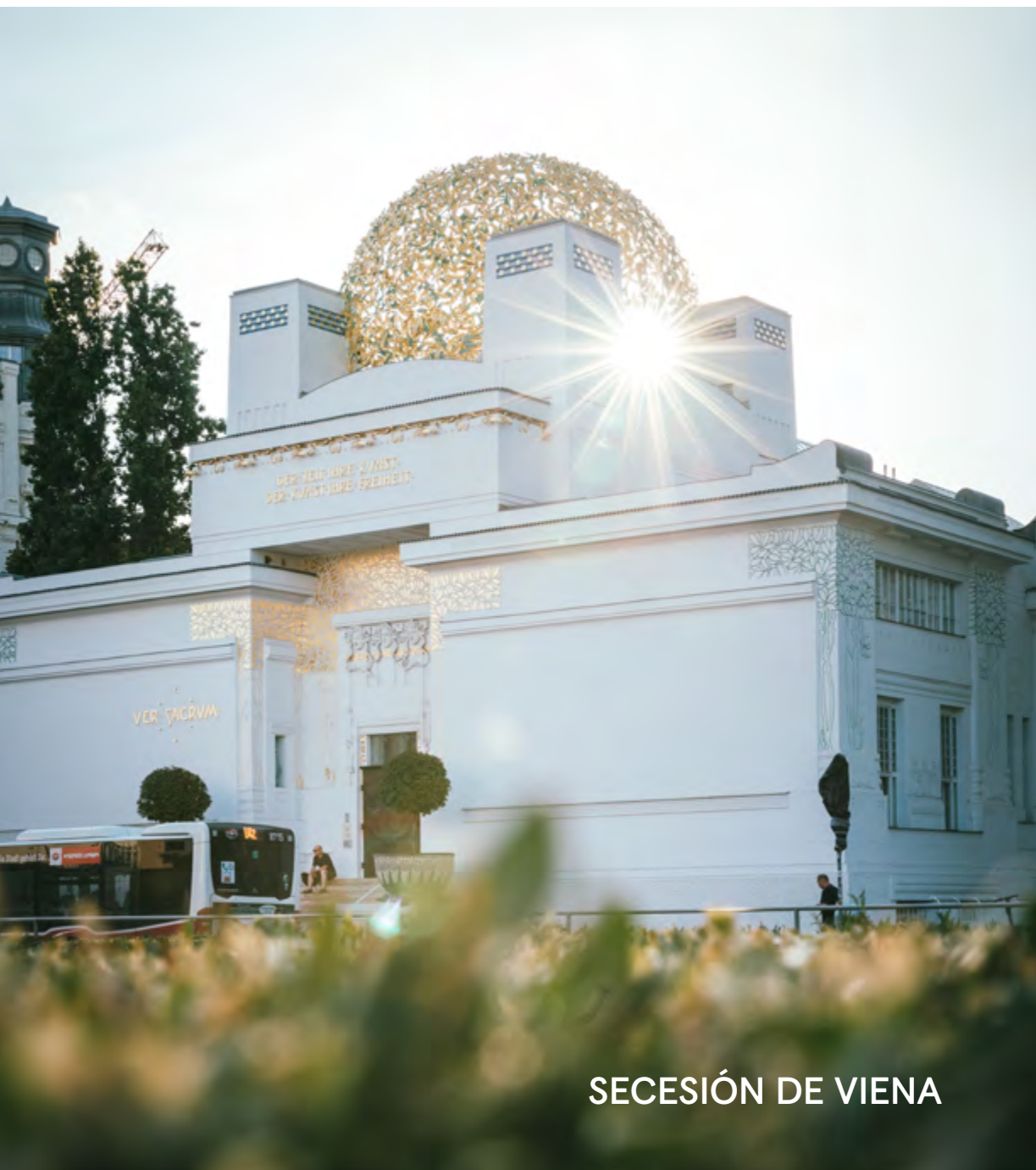
SECESIÓN DE VIENA

Viena suena a Mozart, a Beethoven, a Strauss y a muchos otros que llenaron de notas su aire y su suelo de pasos de baile.