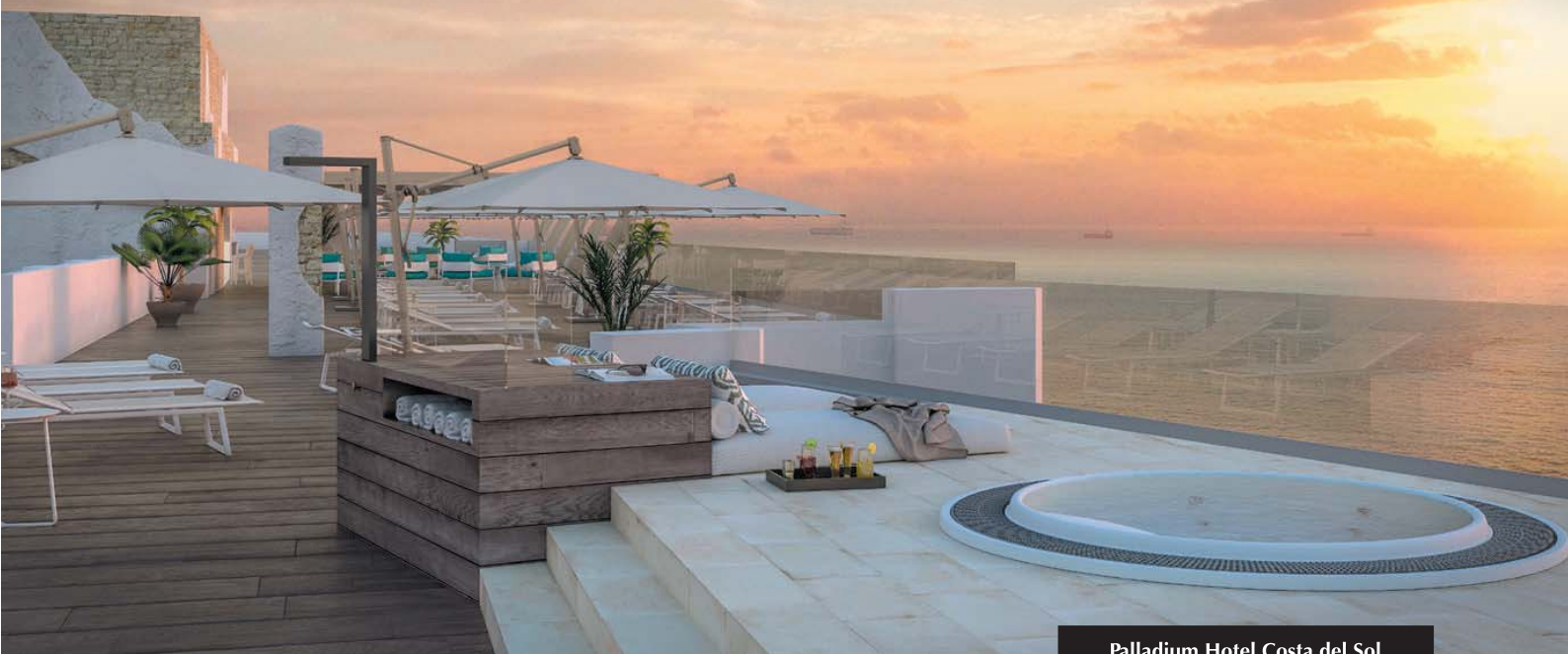
Palladium Hotel Costa del Sol