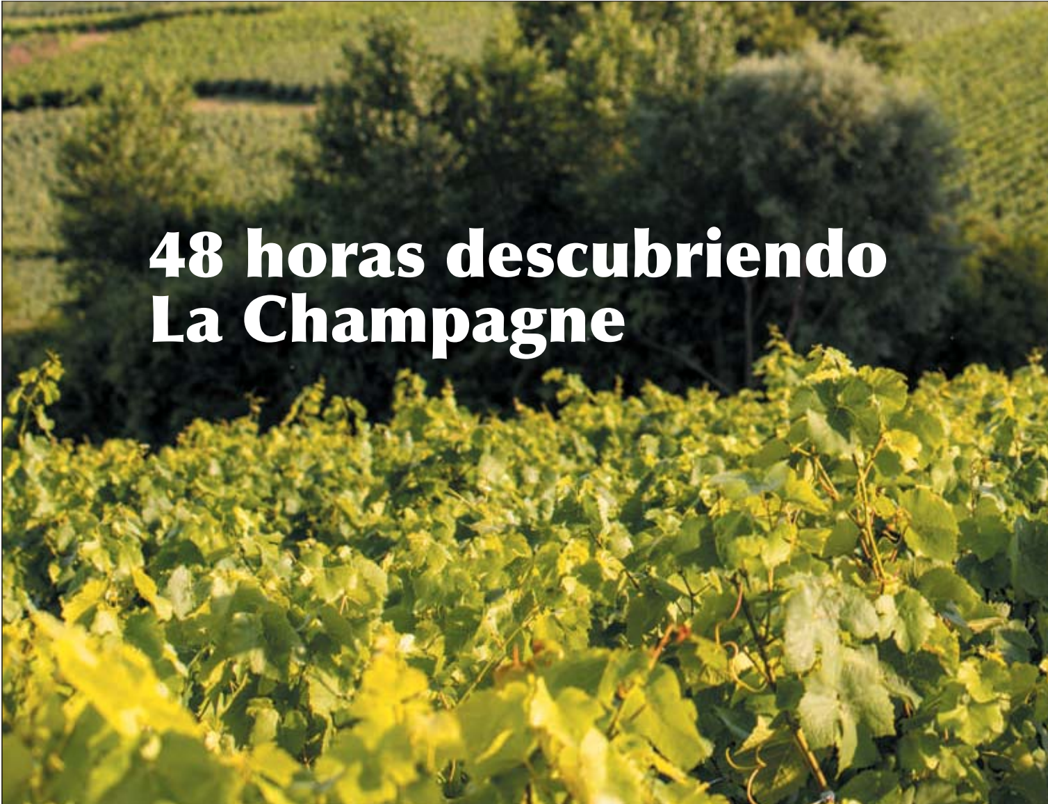
Vignoble - Reims

Escaparse a descubrir La Champagne es mucho más fácil desde esta primavera. Y es que el pasado 31 de marzo se puso en marcha la primera conexión aérea directa entre España y La Champagne. Se trata de los tres nuevos vuelos semanales (con sus respectivos trayectos de retorno) que Iberia Regional Air Nostrum opera desde el 31 de marzo y que unen Madrid con el aeropuerto de Paris - Vatry en menos de dos horas. Una vez allí, tan sólo se necesitan 20 minutos por carretera para llegar a Chalons-en-Champagne y 45 para hacerlo hasta Reims. Así que ahora que La Champagne está mucho más cerca para el turista español, os proponemos acompañarnos en una escapada de 48 horas para disfrutar al máximo de este sofisticado y burbujeante paraíso.