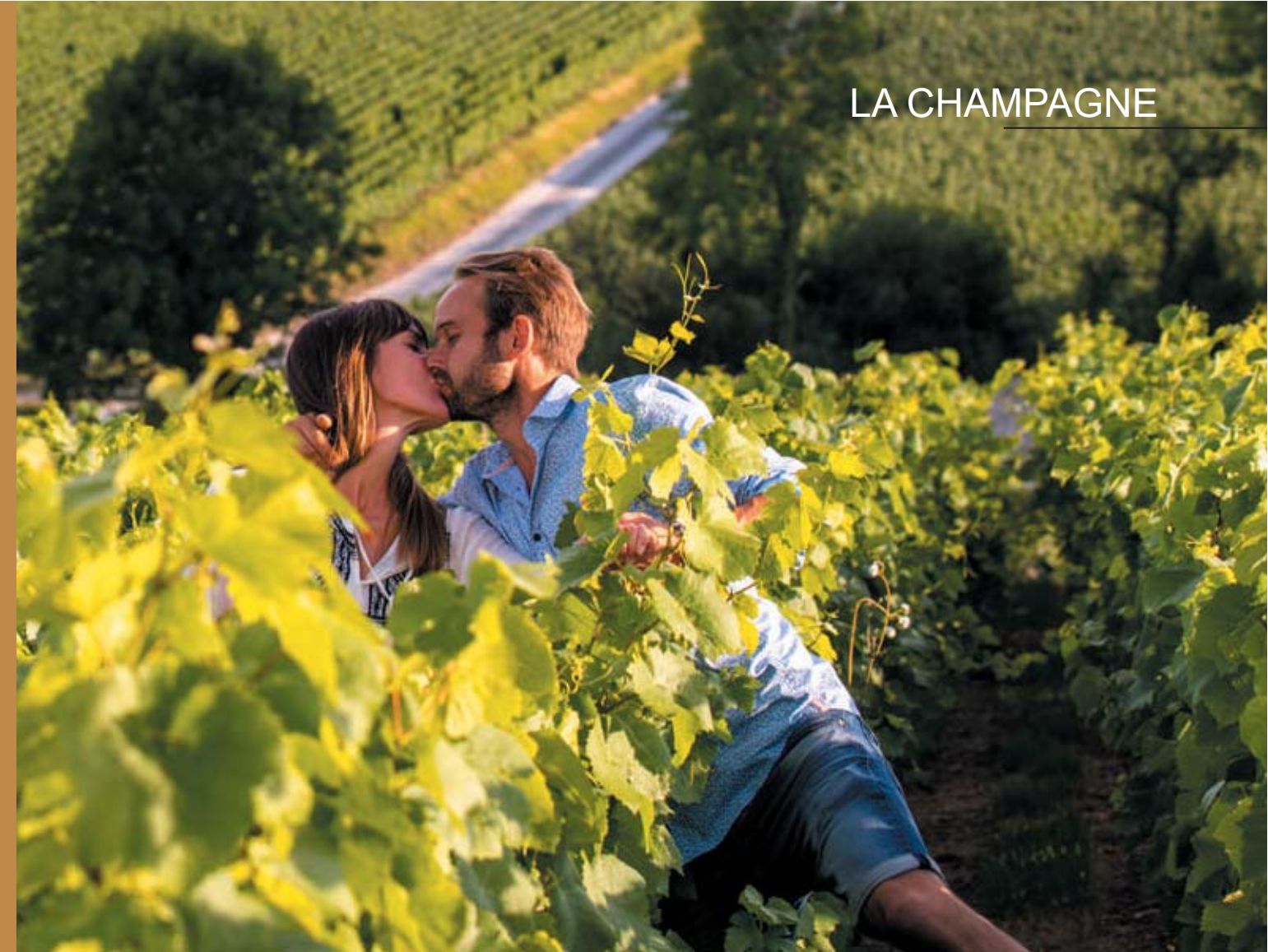
Aj Eco Visite

Pongamos que para descubrir por primera vez La Champagne, hemos elegido el vuelo de los viernes. Nuestro cuartel general en esta ocasión será Reims. Nada más llegar, lo primero que os proponemos es lanzarnos de lleno a descubrir el burbujeante universo de la producción del champagne. Y seguramente, uno de los lugares más especiales del mundo para hacerlo se encuentra en esta ciudad. Se trata de la colina de Saint-Nicaise, con sus más de 370 galerías de creta excavadas desde la época medieval y conocidas como las catedrales subterráneas del champagne, ya que las principales Maisons de Champagne las han elegido como lugar donde dejar reposar sus botellas. ¿Os apetece ver algunas? Dirigiros a la Maison de Veuve-Clicquot y realizar una de sus visitas guiadas. Al acabar, nos acercaremos a contemplar los 4 monumentos Patrimonio Universal