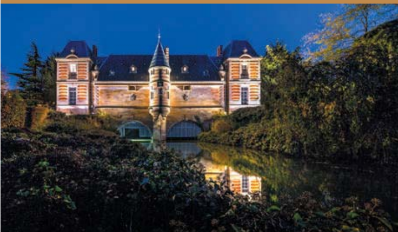
Château du Marché - Châlons-en-Champagne

con su simpatía y su buen hacer, la acompañaremos hasta la mansión que champagne Michel Gonet regenta en la famosísima Avenue de Champagne en Epernay. Allí recuperaremos fuerzas con un almuerzo degustación antes de salir a descubrir esta calle en cuyo subsuelo se almacenan más de 200 millones de botellas. Para haceros una idea, la Maison de Champagne más conocida del mundo, Moët & Chandon tiene aquí sus bodegas, que también se pueden visitar. Pero para conocer donde de verdad empezó todo, nos desplazaremos hasta Hautvillers, un coqueto pueblo en cuya antigua abadía vivió un monje conocido como Dom Perignon. ¿Os suena? Una manera divertida de conocer Hautvillers y sus entornos es alquilando una bicicleta eléctrica con bikeenergy.com y luego recuperar fuerzas en Au 36, un bello espacio gastronómico donde degustar y comprar las principales maravillas de la gastronomía local.