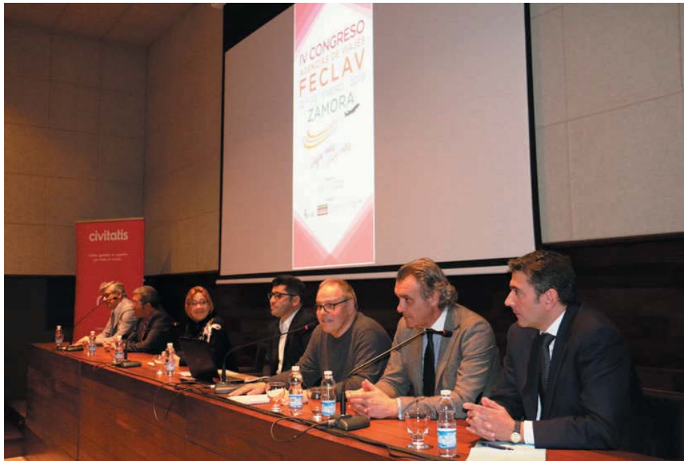
Inauguración del IV Congreso de FECLAV, por parte de las Autoridades de Zamora, la Presidenta de la Diputación y el Concejal de Turismo.

FECLAV supera incluso el ámbito estrictamente organizacional, fortaleciendo las sinergias entre sus miembros y pro-