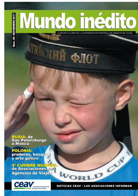
Foto portada: Niño ruso de Moscú con camiseta alusiva al Mundial de Fútbol.