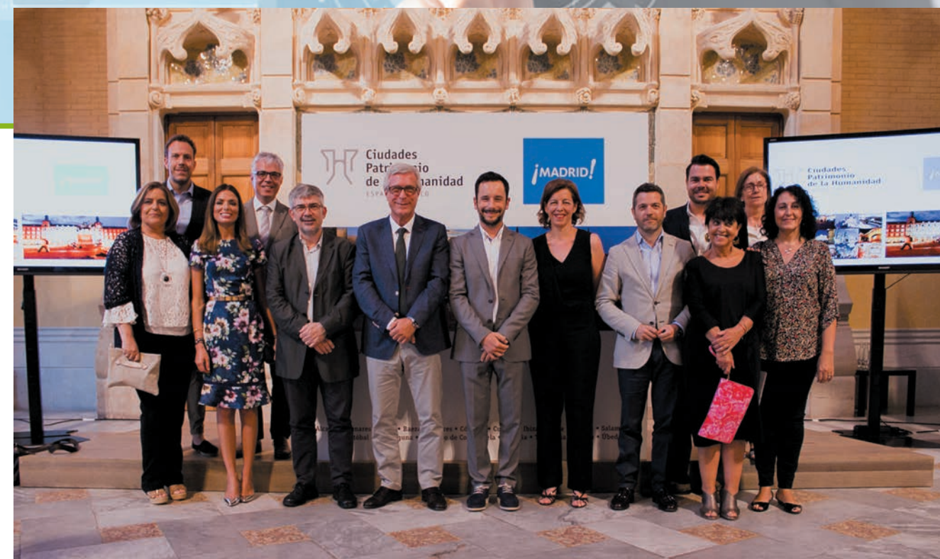
Primera fila de izqda a dcha: Concejala de Cuenca, Concejala de Tarragona, Concejal de Barcelona, Alcalde de Tarragona, Alcalde de Ibiza, Concejala de Alcalá de Henares, Concejal de Salamanca, Concejala de Segovia, Directora de Marketing Madrid Destino. Segunda fila de izqda a dcha: Concejal de Ávila, Director General de Turismo Generalitat de Catalunya, Concejal de Mérida y Diputada de Tarragona.

El Premio GEBTA 2017 a la Trayectoria a Foment del Treball Nacional en reconocimiento a la constante labor formativa e informativa que vienen desarrollando la Oficina de Prevención de Riesgos Laborales y el Foro de RR.HH. en materia de seguridad y prevención asociada a los procesos de internacionalización, de la que destaca la reciente publicación de la "Guía de gestión de la prevención en el proceso de internacionalización en las empresas".