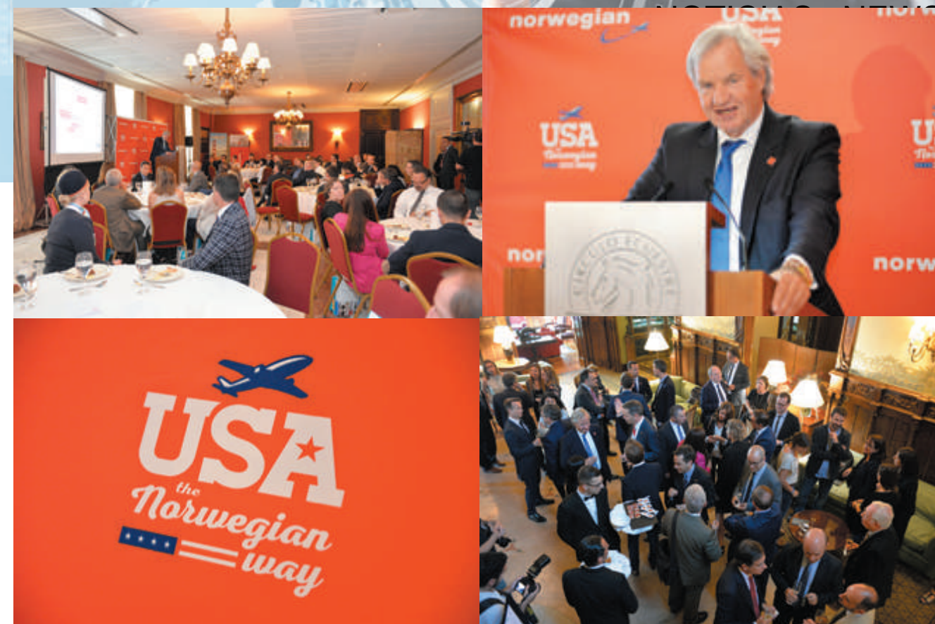
Norwegian presentó el pasado martes 23 de mayo, en el magnífico entorno del Círculo Ecuéstre de Barcelona, todas sus novedades de la mano del CEO de la compañía el Sr. Bjorn Kjos.

contestar por no tener los datos de los viajes que anteriormente eran gestionados de forma individualizada, respuesta a la que mostramos nuestro asombro. Se solicitaron a los representantes de las Agencias de Viajes datos objetivos para seleccionar a las agencias más adecuadas, a lo que CEAV contestó que se debería tener en cuenta que la agencia adjudicataria no haya sido condenada por sentencia por fraude al Estado en un tema de transporte aéreo.