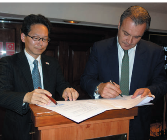
Durante la CEAV Travel Night se presentó el acuerdo de colaboración con la Oficina de Turismo de Japón por el