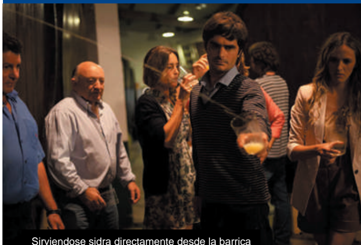
Sirviendose sidra directamente desde la barrica