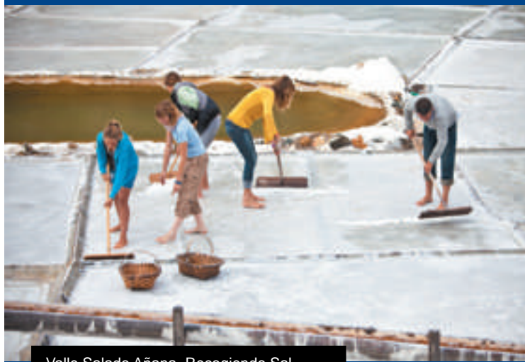
Valle Salado Añana. Recogiendo Sal

La Ruta del Flysch. Navegaremos por la costa del Geoparque de la Costa Vasca, desde Zumaia hasta Mutriku, pasando por Deba. Conoceremos los espectaculares acantilados del flysch, con una historia superior a 60 millones de años. Desembarcaremos en Mutriku para ver el puerto y el casco histórico, declarado conjunto monumental.