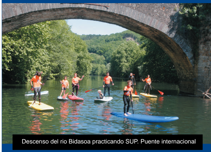
Descenso del río Bidasoa practicando SUP. Puente internacional