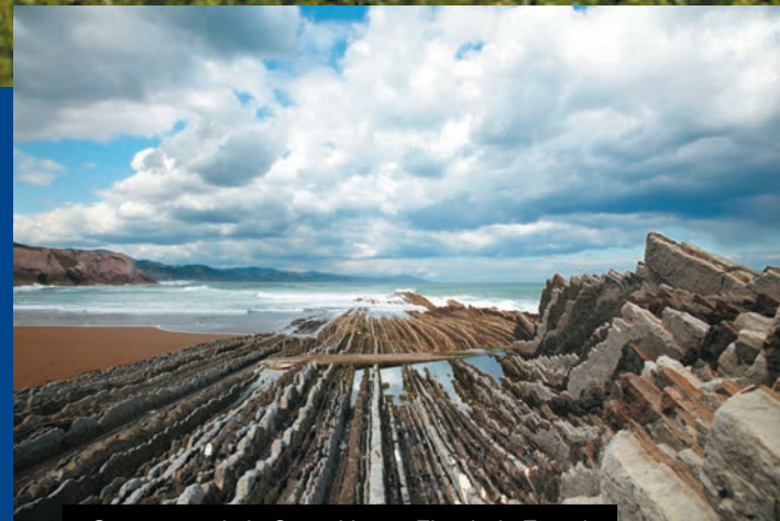
Geoparque de la Costa Vasca. Flysch de Zumaia

https://turismo.euskadi.eus/es/rutas/the-basque-route/aa30-12379/es/