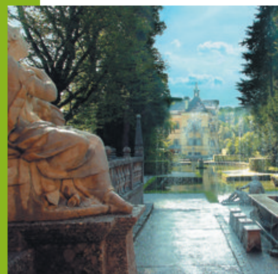
400 años Palacio de Hellbrunn (juegos de agua barrocos)

El colectivo de artistas Neon Golden, residente en Viena, fue fundado en 2005 en Dornbirn (estado federado de Vorarlberg) y concebido como plataforma de arte mediático experimental en un contexto de club. El grupo consta actualmente de 14 miembros de orígenes tan diversos como el diseño, el arte o la programación. En el transcurso de los últimos años, Neon Golden ha trasladado su centro de atención de los visuales generativos en vivo hacia una mezcla de gráficas animadas, material fotográfico descubierto y visuales generativos en vivo. Además del contenido en sí, el grupo se dedica también al desarrollo de complejas configuraciones e instalaciones, para las cuales se utilizan tecnologías diversas, tales como el vídeo mapping, paredes LED, sistemas multi-canal, luz y láser para combinar todos los elementos y convertirlos en una experiencia única. www.neongolden.net #ViennaSphere #WeloveVienna - sphere.vienna.info/es