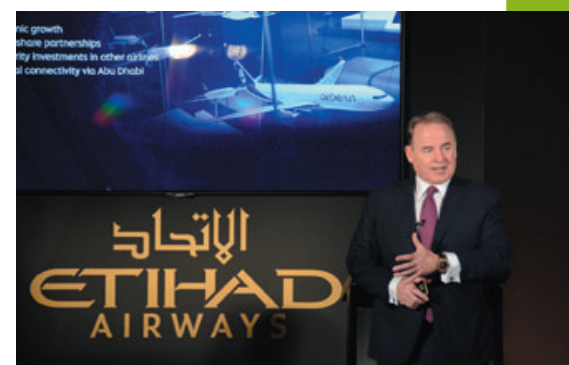
Presidente y Consejero Delegado de Etihad Airways, James Hogan, dirigiéndose a los medios en la conferencia de prensa en Madrid.

"Actualmente alrededor de 1.000 empresas españolas operan en los EAU y más de 12.000 españoles viven y trabajan allí y las cifras van en aumento. Los EAU son el gran socio comercial de España en la región del Golfo, con un volumen comercial que se ha duplicado en los últimos cinco años, aumentando de 1.000 millones