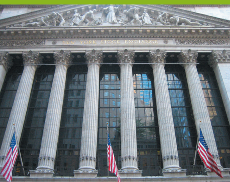
Sala de la Antigüedad Clásica llena de sarcófagos romanos en el MET, Estación Central y fachada de la Bolsa en Wall Street.

138th Street. Fundada en 1908 es la iglesia negra más vieja de Nueva York. No se puede ir en pantalones cortos y el acto religioso dura unas dos horas, aunque hay que llegar como mínimo una hora antes para hacer la cola de acceso, ya que suele completarse el aforo. Si le dicen que ya no entrará, pida que le den varias alternativas de otras