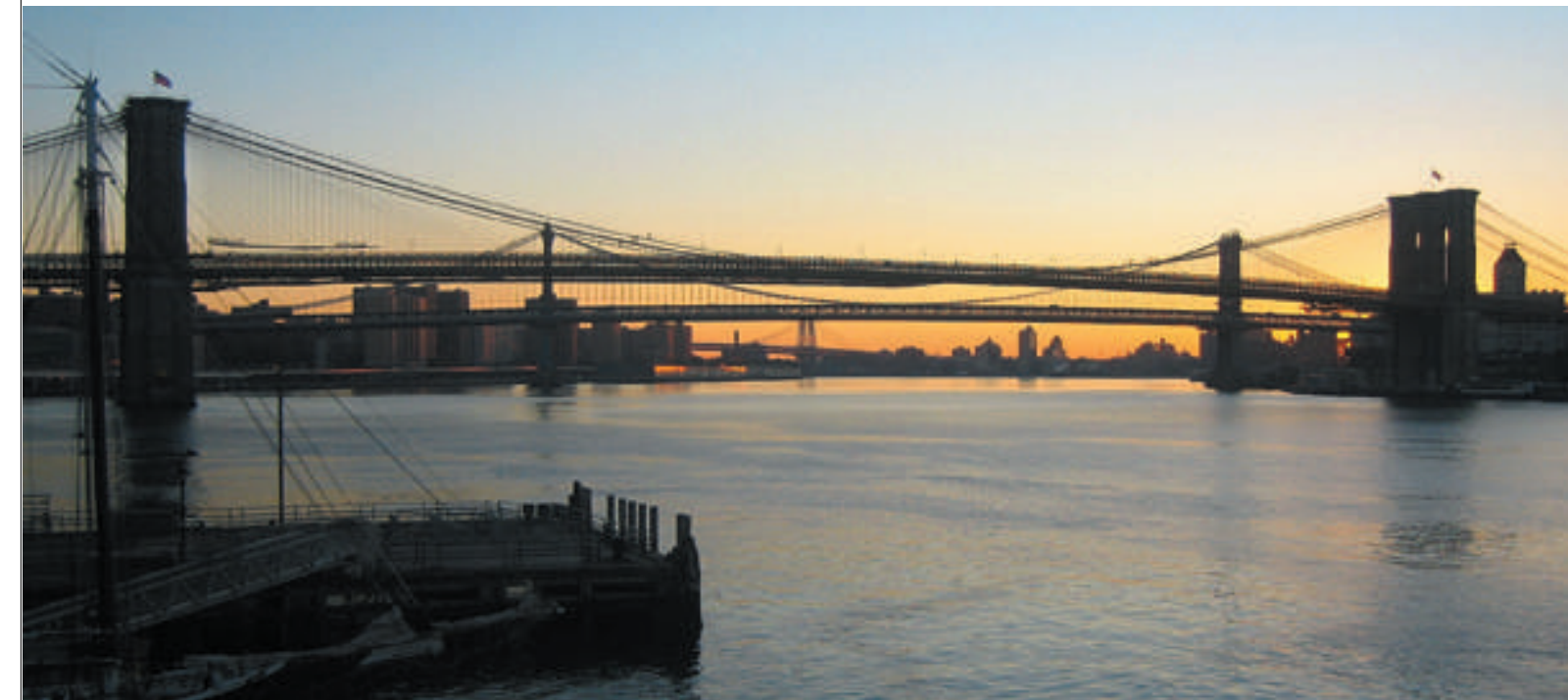
Los puentes de Brooklyn y Manhattan se solapan durante la salida del sol sobre el East River

A finales de 1880, el MET comenzó a adquirir arte antiguo y piezas de Oriente Próximo. La colección incluye obras de las culturas sumerias, hititas, sasánidas, asirios, babilonios y elamitas entre otros, así como también una gran colección de objetos únicos de la Edad de Bronce. Aunque una buena parte de las piezas egipcias proceden de colecciones privadas, casi la mitad provienen de descubrimientos hechos a través de excavaciones arqueológicas organizadas por el mismo museo entre 1906 y 1944. La colección está compuesta por más de 36.000 piezas, clasificadas desde el Paleolítico hasta la época de dominación romana, y casi todas ellas se encuentran expuestas en las cuarenta galerías egipcias del museo. Entre las piezas más valiosas destacan un conjunto de 24 maquetas de madera, descubiertas en una tumba de Deir el-Bahari en 1920. Sin embargo, la pieza más popular del departamento continúa siendo el templo de Dendur; desmontado por orden del gobierno egipcio, para salvarlo de la futura inundación