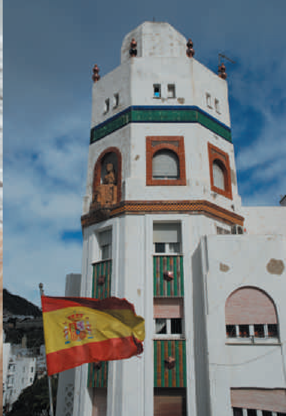
Vista de la ciudad moderna de Tetuán tomada desde la terraza del Instituto Cervantes, donde Sira Quiroga y Jamila secan el vestido hecho para Rosalinda Fox. En medio, hombre de Tetuán.

Sobre estas líneas, puerta de una casa de la medina de Tetuán, que sirvió de escenario de la taberna donde se hace el pacto de la venta de las pistolas.